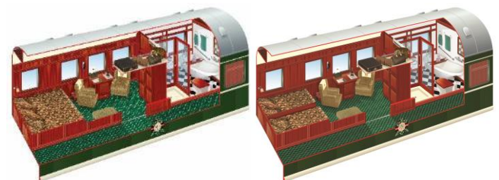
Die Aufteilung der Zimmer kann von der Abbildung abweichen.