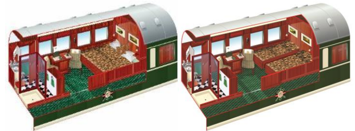
Die Aufteilung der Zimmer kann von der Abbildung abweichen.