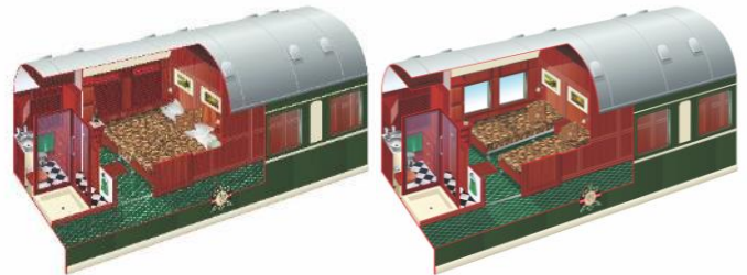
Die Aufteilung der Zimmer kann von der Abbildung abweichen.