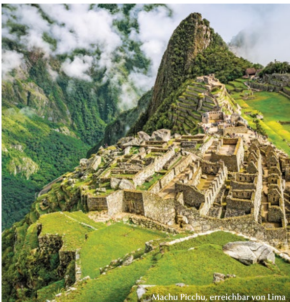
Machu Picchu, erreichbar von Lima