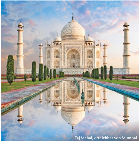
Taj Mahal, erreichbar von Mumbai