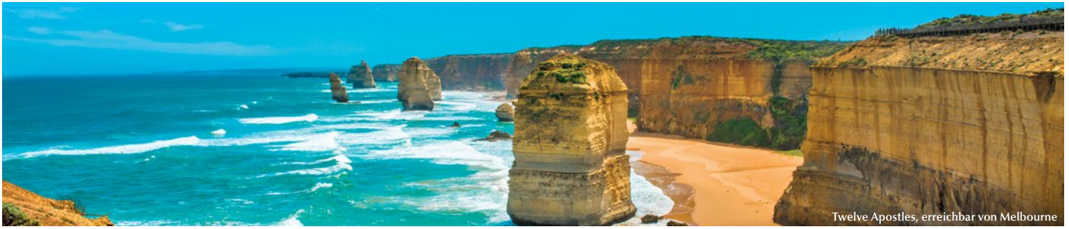
Twelve Apostles, erreichbar von Melbourne