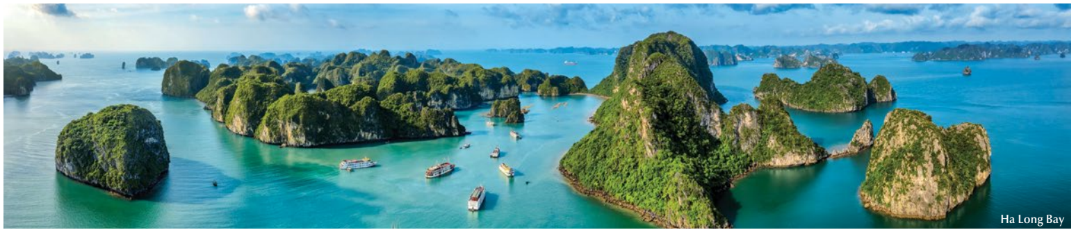
Ha Long Bay